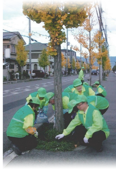
草津市環境・福祉推進グループ 草津ほほえみの会

歩道の花壇の水やり、犬のフンの掃除、病院への送迎と院内案内、献血の呼びかけ、障がい児の学童保育の手伝い、家庭ごみの堆肥化など環境から福祉まで多岐にわたるボランティア活動を27年間、地道に続けてきました。