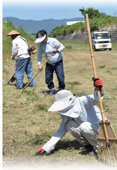
あゆみの会 (出屋敷団地)

不法投棄が絶えなかった場所が、地域住民自らの手で憩いと出会いの緑の空間へと生まれ変わりました。清掃、草刈り、花づくりなど、コツコツと努力を続け、不法投棄の防止、地域のコミュニティづくり、防犯面での効果も発揮しています。