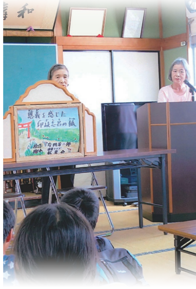
読書グループ松葉会

不法投棄が絶えなかった場所が、地域住民自らの手で憩いと出会いの緑の空間へと生まれ変わりました。清掃、草刈り、花づくりなど、コツコツと努力を続け、不法投棄の防止、地域のコミュニティづくり、防犯面での効果も発揮しています。